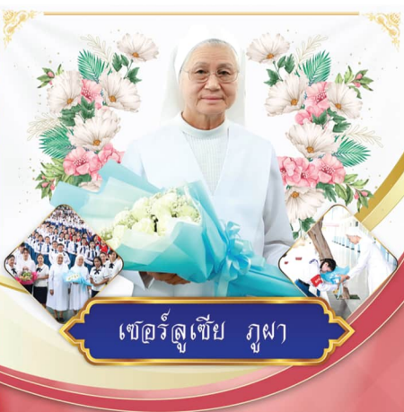
เซอร์ลูเซีย ภูผา